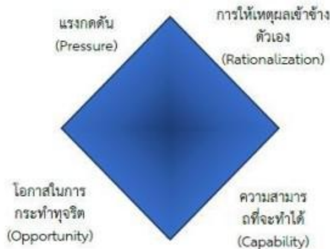
การพัฒนาของทฤษฎีสี่เหลี่ยมการทุจริต (Four-sided Diamond)