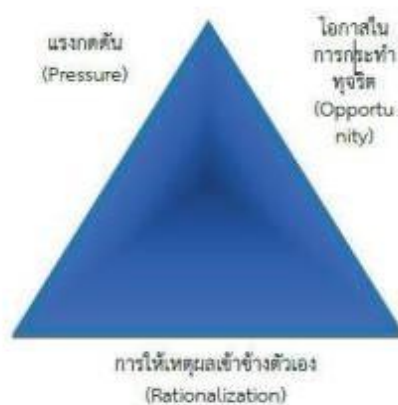
ภาพ การพัฒนาของทฤษฎีสามเหลี่ยมการทุจริต